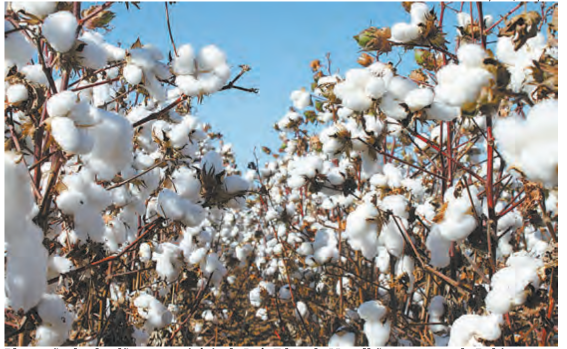
Plantação de algodão no município de Luís Eduardo Magalhães, no oeste da Bahia