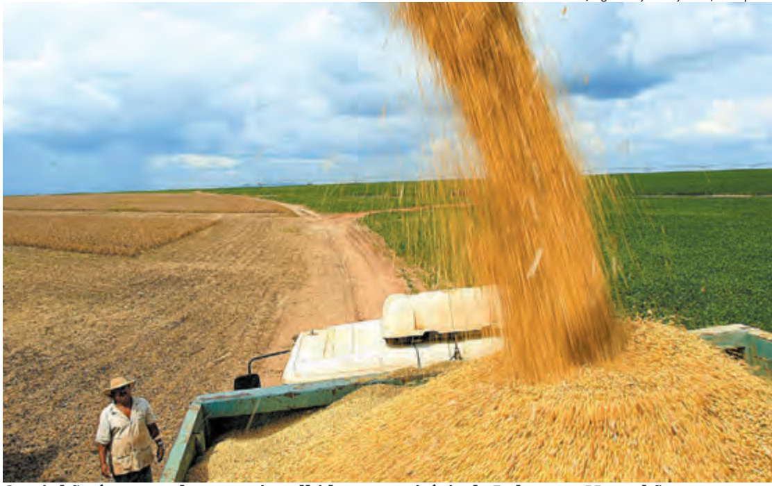
Caminhão é carregado com soja colhida no município de Balsas, no Maranhão